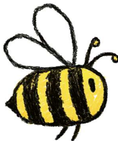
Tekening: Miss Publicity

Wij als imkers krijgen dikwijls de vraag: "Hoelang is honing houdbaar?" Op de eerste plaats: De wet bepaalt . Zij verplichten ons om 2 jaar op de honingpotten te zetten. Voor ons imkers is dit een onjuiste beslissing.