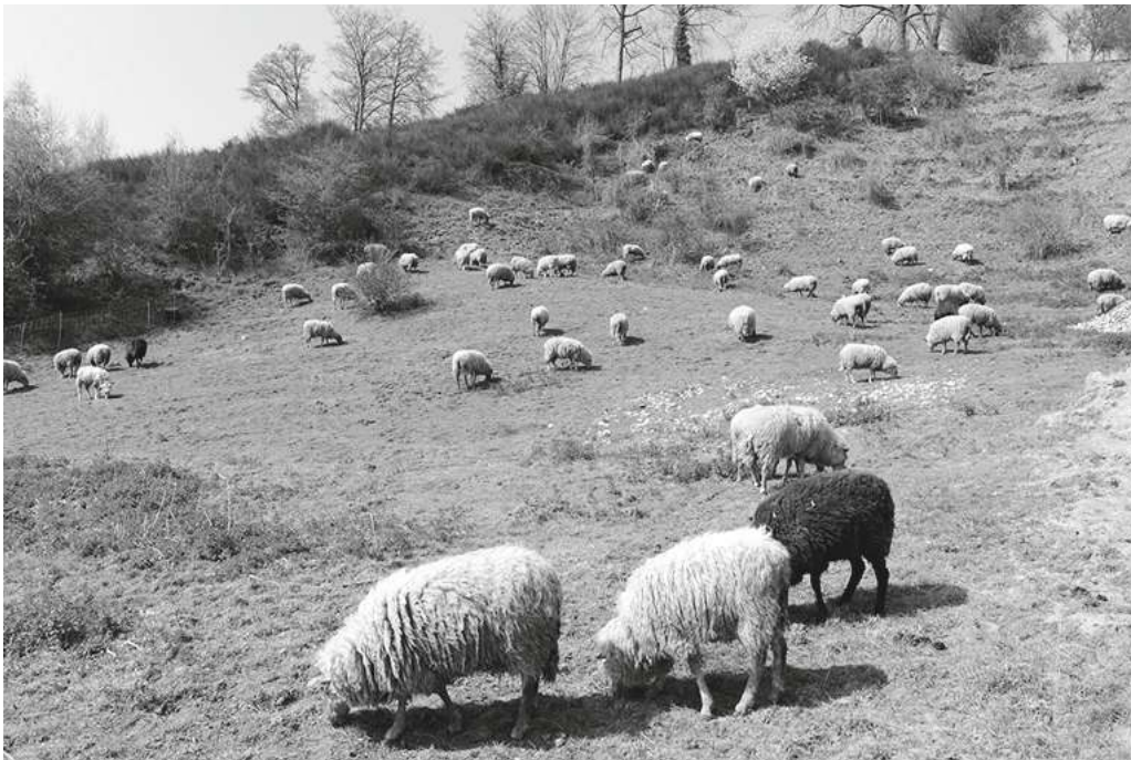
Afgelopen voorjaar liepen er al enkele weken Mergellandschappen in de Vitschen.

begraasde percelen op een helling met een kalkrijke ondergrond. Ze zijn matig voedselrijk door de van de koeien afkomstige bemesting, maar worden niet verder verrijkt met kunstmest. Zoals hoger aangegeven, is dat funest voor de typische vegetatie. Typische soorten zijn Margriet en Kamgras, maar ook zeldzame soorten als Aarddistel, Gulden sleutelbloem, Ruige weegbree, Bevertjes en Hokjespeul. Aan de randen, waar er wat meer verruiging is, vinden we bijvoorbeeld Marjolein, Beemdkroon en Wilde peen.