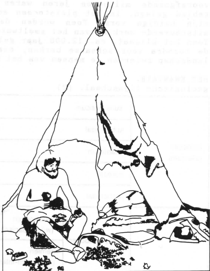
Prehistorische vuursteenbewerker met slapende vrouw in tent

Heel bijzonder is natuurlijk dat deze tentoonstelling onder meer handelt over mensen die ca. 12.000 (!) jaar geleden in MESH de lokale vuursteen de "Stenen Berg" opdroegen om hem daar te bewerken, en meteen van daaruit de tocht van de rendieren te observeren. De aanleiding tot de inrichting van deze tentoonstelling in Voeren ligt dan ook in de veronderstelling dat de rendierjagers die ooit Mesch bezochten, waarschijnlijk ook wel eens voet op Voerense grond hebben gezet.