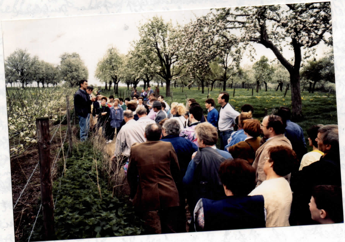
"D'r Koeënwoef" 1992, nr 7