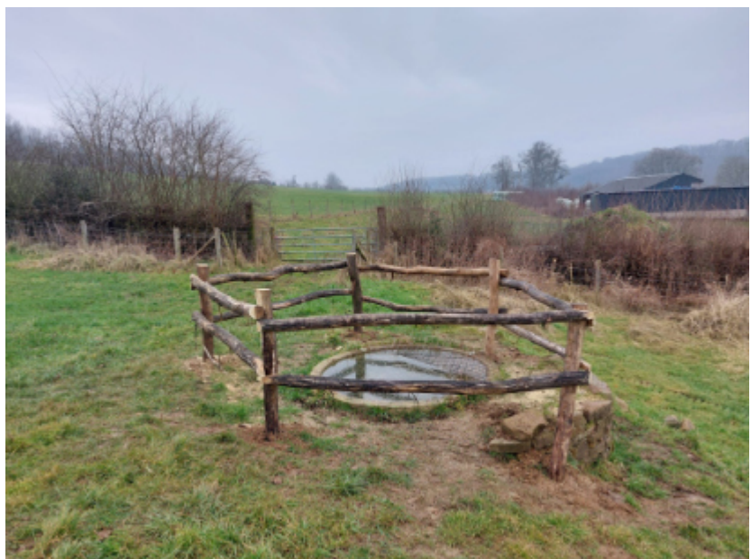
Met de aanleg van kunstmatige poelen zoals op de foto hierboven probeert Natuurpunt de vroedmeesterpad en andere soorten amfibieën meer overlevingskansen te geven.